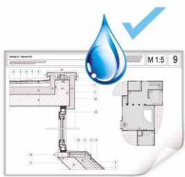
Impresiones resistentes al agua