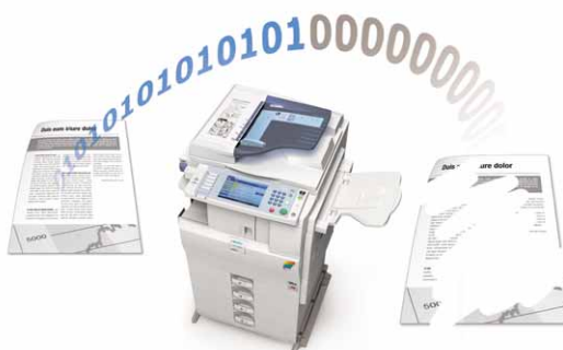
Sobrescritura de datos de disco duro

Las funciones de autenticación y encriptación protegen sus datos confidenciales. Además, las MP C2050/MP C2550 son compatibles con paquetes opcionales de seguridad como HDD Data Overwrite (Sobrescritura de datos de disco duro), Data Security for Copying (Seguridad de datos de copia), Card Authentication (Autenticación de tarjetas) y Secure Print Release (Liberación segura de impresión).